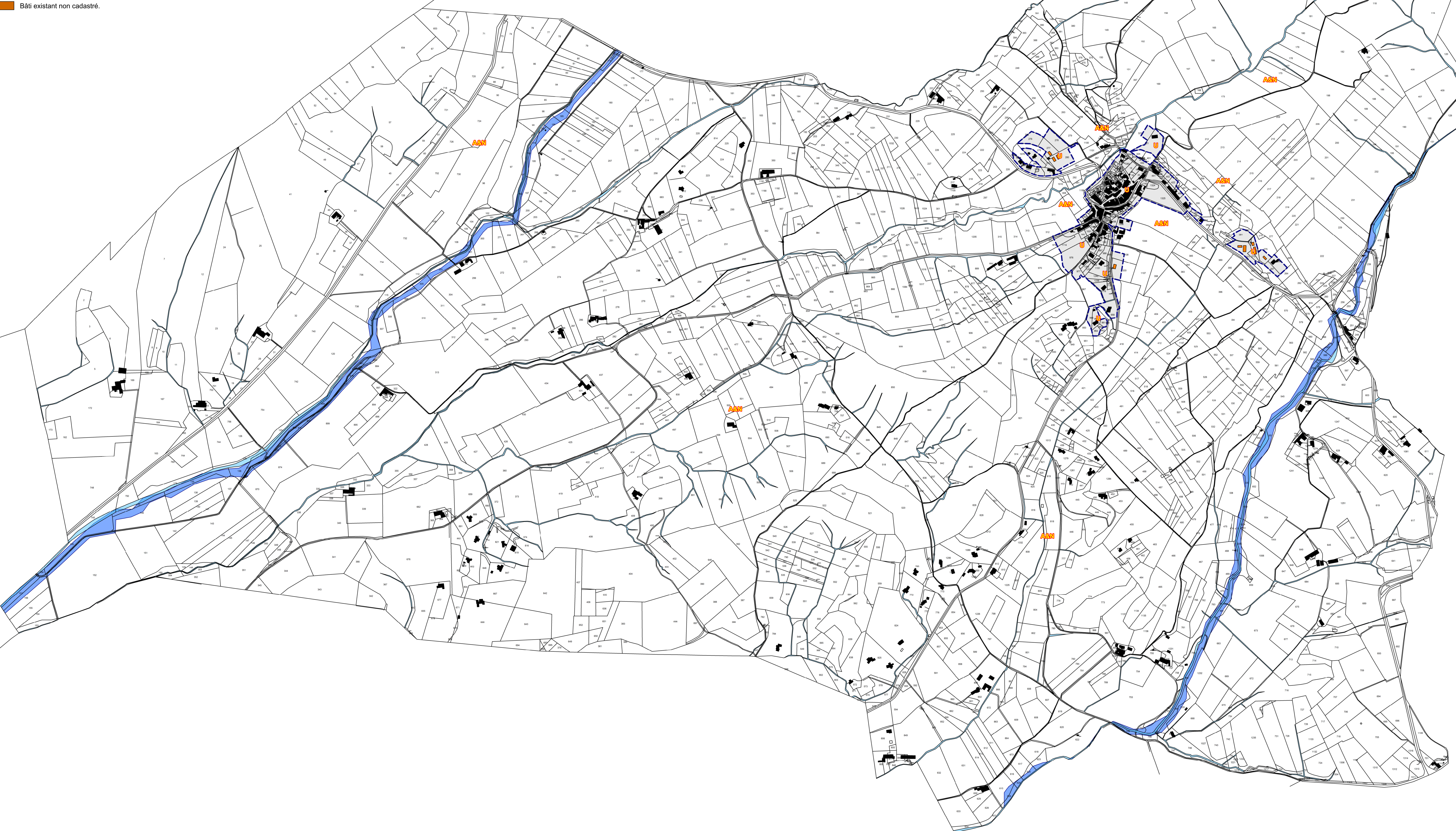
Encart 2 : le village (1/2500 e )