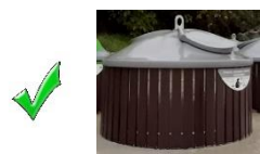
Conteneur semi-enterré pour les ordures ménagères

Création de points d'apport volontaire sur la commune avec l'ensemble des flux de déchets (ordures ménagères résiduelles, emballages recyclables, papiers, verres et cartons). Les types de contenants à utiliser sont les suivants :