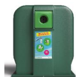
Colonne aérienne pour le tri sélectif