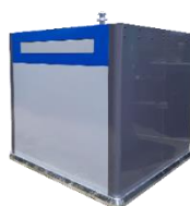
Colonne aérienne pour les cartons épais (blancs ou bruns)